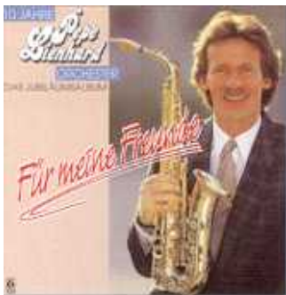
Album für «Für meine Freunde».

Im Herbst spielt Pepe mit seinen Musikern das Album «Für meine Freunde» ein.