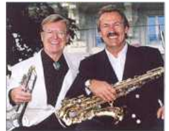
Hazy Osterwald und Pepe Lienhard – ein Herz für Swing.

Zehn ausverkaufte Konzerte, bei denen auch Alt-Meister Hazy Osterwald auf dem Vibraphon «mitswingt», belohnen Pepe für die grosse Mühe.