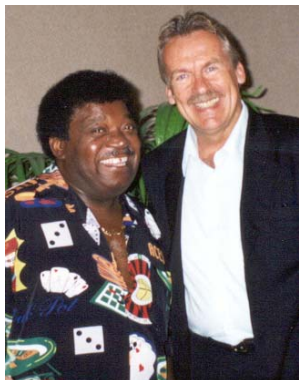
Percy Sledge & Pepe

Als Stargast engagierte Pepe Lienhard den US-Soulsänger Percy Sledge („When A Man Loves A Woman“). Auch diese Tournee konnte melden: Ausverkaufte Säle!