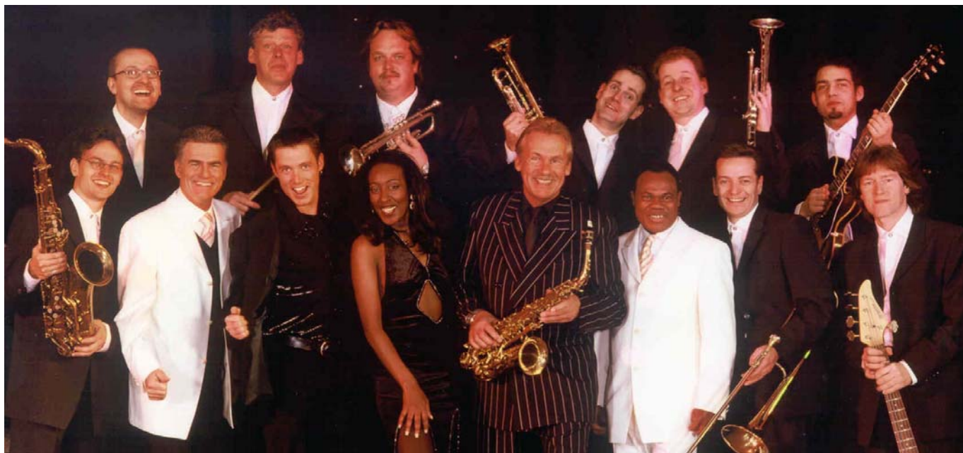
Pepe Lienhard & The Band 2002

Das zweistündige Konzertprogramm umfasst Werke legendärer Komponisten wie Duke Ellington, Count Basie, Cole Porter usw. Pepe's hochkarätige Big Band garantiert für ein Konzerterlebnis erster Güte.