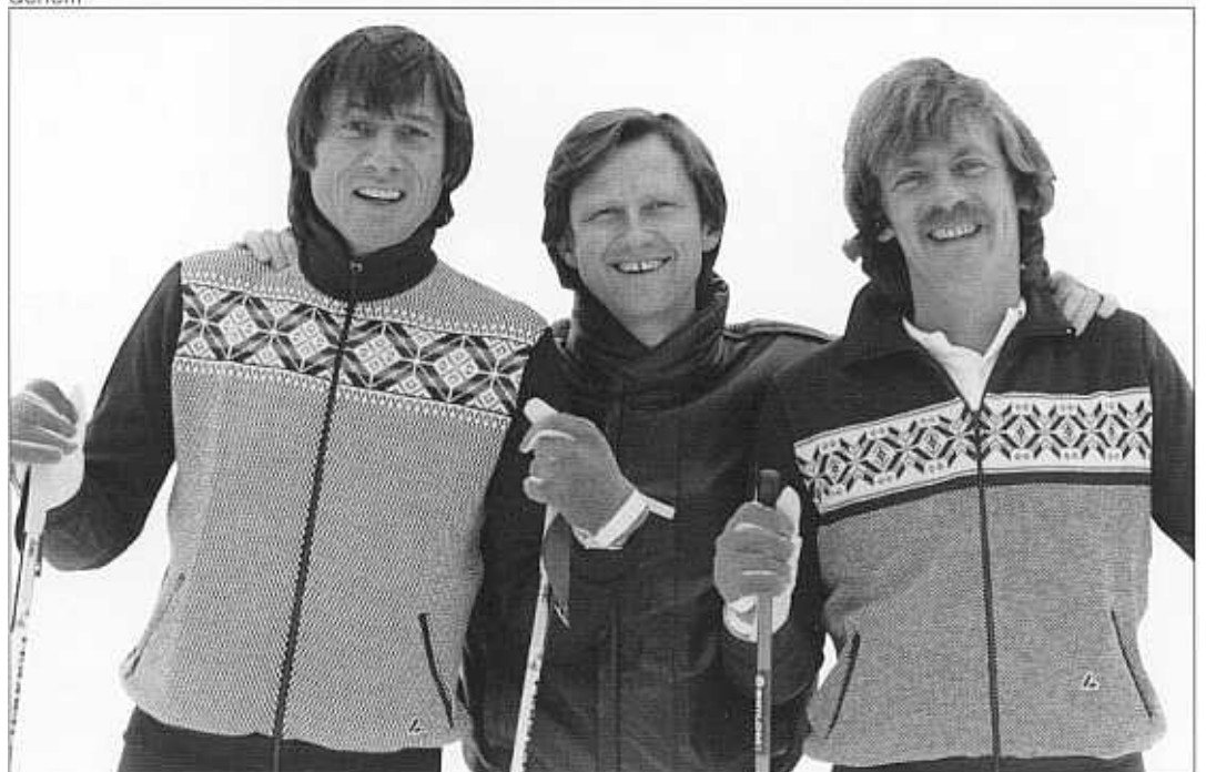
«Langläufer leben länger»: Gruppenbild mit sinniger Symbolik.