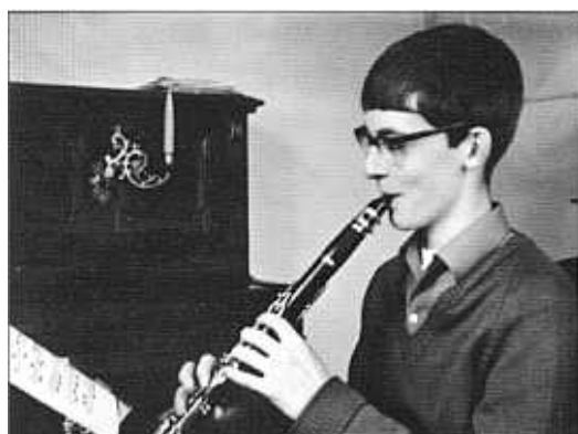
Wer zuhause ordentlich übt,.

«Damals», schwärmt Pepe Lienhard, «gab es noch viele Dancings, hatten alle Platz zum Spielen.» Hazy Osterwald, zu jener Zeit Pepes Idol, war die dominierende Figur. Mit seinem Sextett gab Hazy den Tarif an, und dazu gehörte zweifellos eine gute Show.