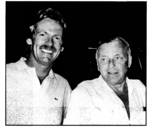
Gipfeltreffen im «Sporting Club» Monte Carlo: «Mister Showbusiness» Frank Sinatra.