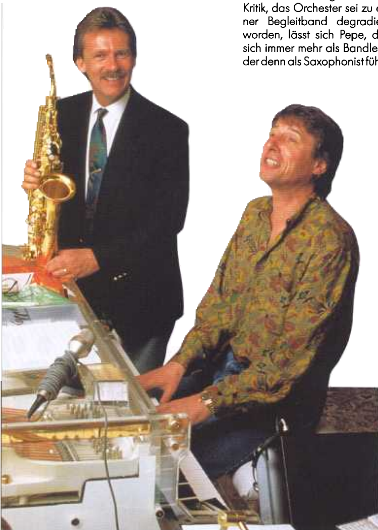
Pepe Lienhard und Udo Jürgens in gemeinsamer Sache: Legen beide Wert auf Perfektion!

gleichbare Big Band aufweisen kann». Stellvertretend für das dicke Lob, das der Pepe Lienhard Band nach der Premiere zuteil wurde, sei eine Passage aus der grössten Zürcher Tageszeitung zitiert: «Das Repertoire dieser Band mit zweifellos gesicherter Zukunft: vielseitig, abwechslungsreich, modern und doch für heutige Begriffe durchaus kommerziell, mit vielen Show-Elementen, mit sehr gutem Tonmeister und dito Lichtregisseur.» Mitverantwortlich für die schier unglaubliche Referenzliste an Superstars, die sich ins Gästebuch der Band eingeschrieben haben, war natürlich Monte Carlo, wo das Orchester während zwei Saisons im «Sporting Club», Europas Showtempel Nummer 1, als Hausband gastierte. Diese mehr als ehrenvolle Berufung, meint Pepe, bedeute bis anhin den wohl wichtigsten Schritt in einer nicht nur für Schweizer Verhältnisse einmaligen Karriere. Im gleichen Atemzug muss auch ein europäisches Gesellschaftereignis der Sonderklasse erwähnt werden: seit sechs Jahren ist die PLB am Wiener Opernball dabei. Dass das wagemutige Experiment nicht nur eitel Freude brachte, braucht kaum erwähnt zu werden. Noch einmal unterlief Pepe der Fehler wie zu Sextett-Zeiten, im gol-