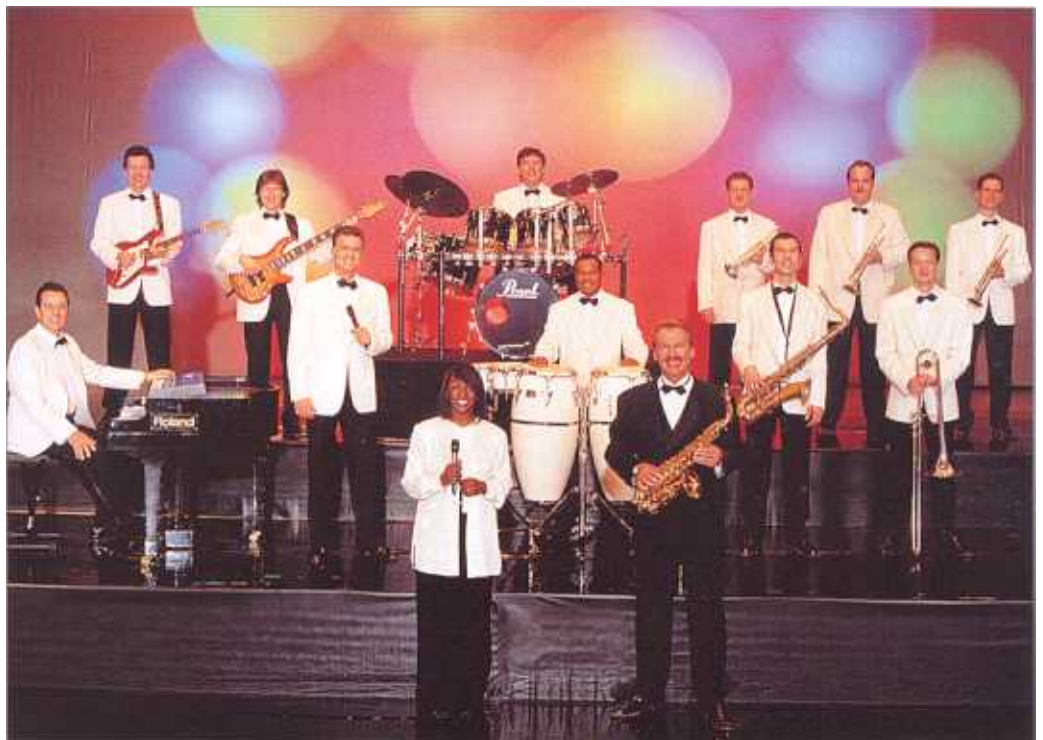
Das Pepe Lienhard Orchester – in Top Form