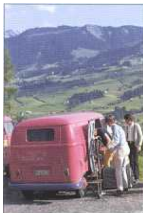
Kosmopolitisch: Aargauer Proben im Toggenburg.

Rückkehr eines Jugendtraums: Pepe scharf 13 Musiker und ei-