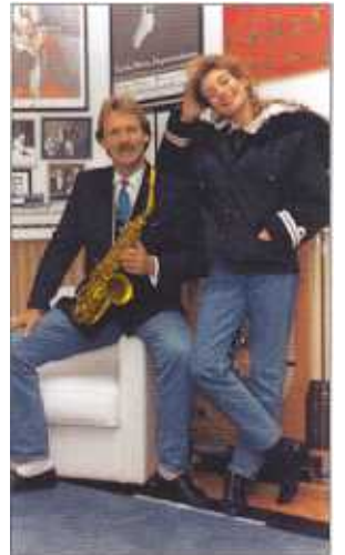
Mit Pepes Orchester von Triumph zu Triumph geeilt: Der deutsche Musical-Star Ute Lemper.