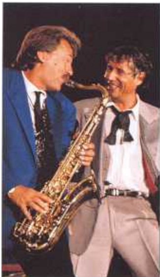
Pepe Lienhard und Udo Jürgens – Die Bühne ist ihr Leben

Bereits im Herbst 1994 geht die Pepe Lienhard Band wieder mit Udo Jürgens auf Tournee, welche mit über 120 Konzerten bis weit ins Frühjahr 1995 reicht. Es ist eine Jubiläums-Tournee, denn Udo Jürgens wird 60 Jahre alt.