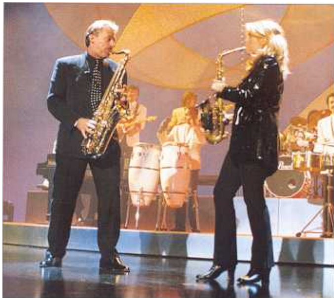
Pepe Lienhard und Candy Dulfer im Duett

nicht laut – die Songs sind eher für die ruhigeren und schönen Minuten des Lebens gedacht. Seine Instrumentalmelodien beschenken die Seele mit Streicheleinheiten.