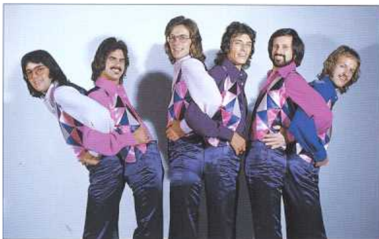
Pepe-Pop der Sechziger: Beatnik-Einflüsse augenfällig.

menarbeit, die später noch viele Früchte tragen sollte! Langsam reifte in Pepe der Entschluss, trotz riesigen Erfolgs des Sextetts eine Big Band auf die Beine zu stellen. Um es präziser auszudrücken: es war ein einsamer Entschluss, der viele Kritiker zum Ausspruch verleitete, Pepe säge den Ast ab, auf dem er so bequem sitze. Doch einmal mehr liess sich der Lenzburger nicht von dem eingeschlagenen Weg abbringen. «Geld verdienen will jeder», sagt er, «doch noch wichtiger ist es, wie man es verdient!» Mit der Zeit sei ein Sextett musikalisch halt doch limitiert, und er möchte nicht bis zum 60. Le-