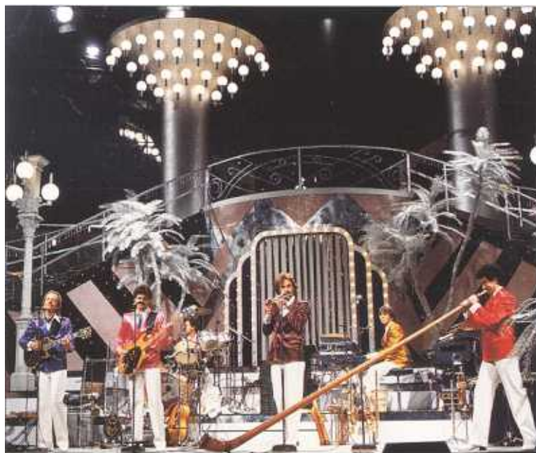
Alphom als Markenzeichen: Single-Hit mit «Swiss Lady».