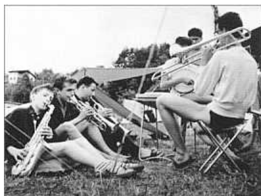
.kann auch im Freundeskreis brillieren!