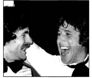
Erster «Kunde» von Pepes Big Band: Sänger, Entertainer, Komponist und Musiker Udo Jürgens.