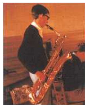
Geschenk seiner Mutter: Das erste Saxophon.

an uns, ich hatte schon Verträge für ein halbes Jahr, ehe wir alle Musiker zusammenhatten!» Im Juli 1969 rückten die sechs Musiker, Spitzensportlern gleich, ins Trainingslager im Toggenburg ein; Burger hatte ihnen ein Bauernhaus und einen kleinen Übungsraum vermittelt. Hart, unerbittlich und diszipliniert bereitete man sich auf das neue Leben vor, und dieses begann am 1. August im St. Galler Dancing «Trischli». Pepe machte es wie die Grossen in Amerika: zur Feuertaufe be-