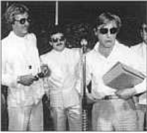
Kennen sich seit langer Zeit: Pepe und Helvetiens erfolgreichster Kabarett-Export «Emil».

treffen mit Ute Lemper, was später eine gemeinsame Tournee zur Folge hat. Und schliesslich wird die PLB unverzichtbarer Bestandteil von «Was wäre wenn?» (ZDF/ORF).