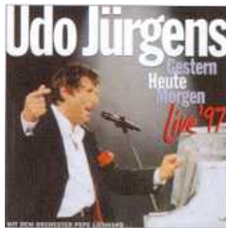
Pepe Lienhard Orchester – auch auf der Live-CD mit dabei

Lienhard Orchester für den musikalischen Background verantwortlich.